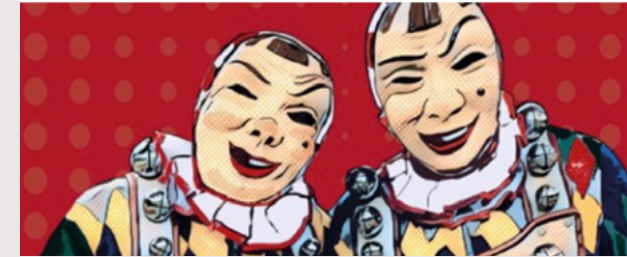
2020 Narrenzunft Neustadt Fotoshooting und Illustrationen