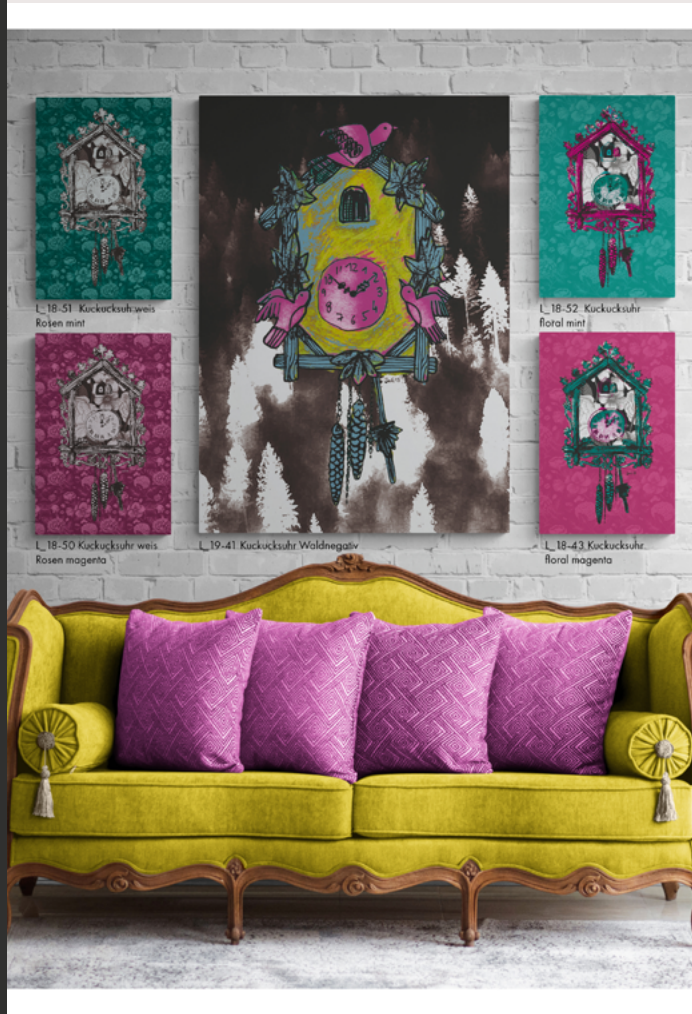
L_18-51 Kuckucksuhr weiss Rosen mint