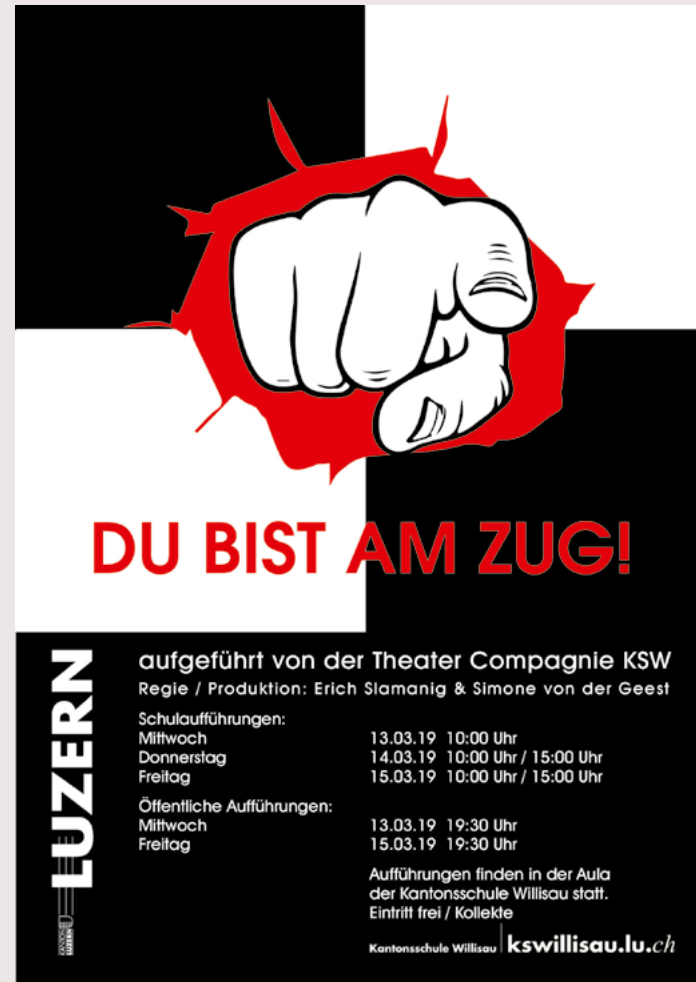
2019 Du bist am Zug! Plakat für ein Theater Auftraggeber: Theater Compagnie KSW Luzern