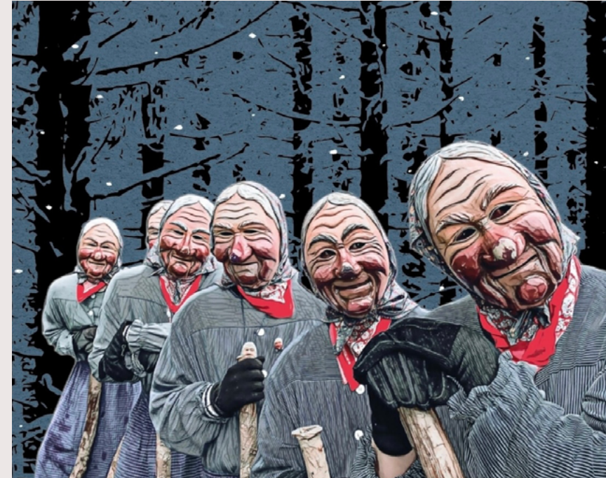
2021 Narrenzunft Kolmewiber Fotoshooting: Fotos und Illustrationen