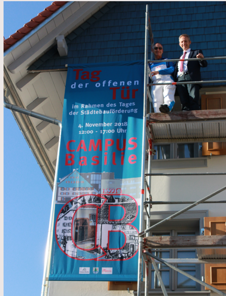
2018 Campus Basilie Titisee Neustadt Tag der offenen Tür im Rahmen des Tages der Städtebauförderung Plakat Auftraggeber: Stadt Titisee-Neustadt