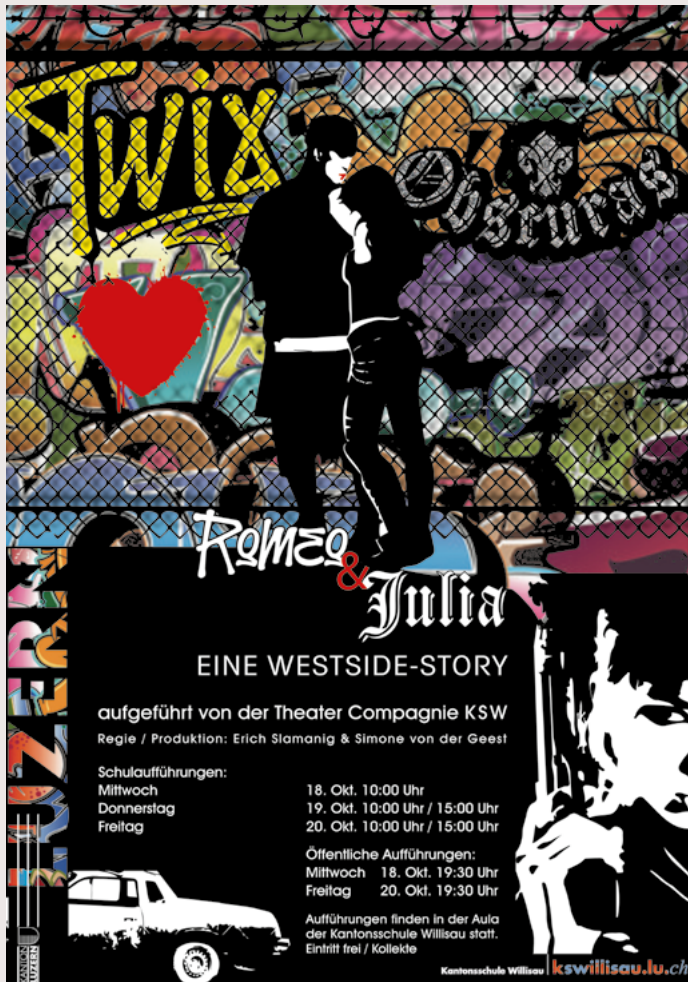
2017 Romeo & Julia - Eine Westside Story Plakat für ein Theater Auftraggeber: Theater Compagnie KSW Luzern